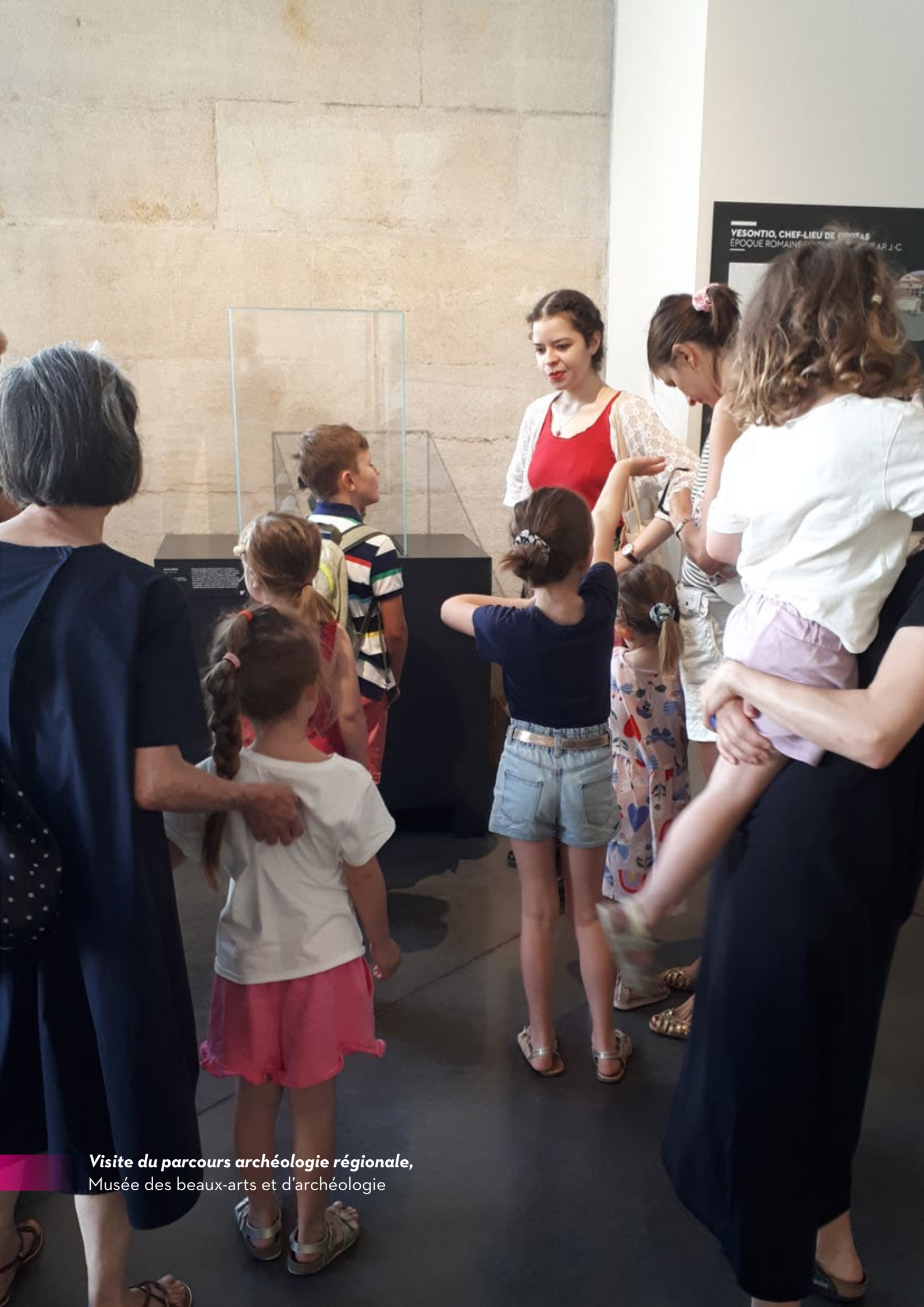
Visite du parcours archéologie régionale, Musée des beaux-arts et d'archéologie