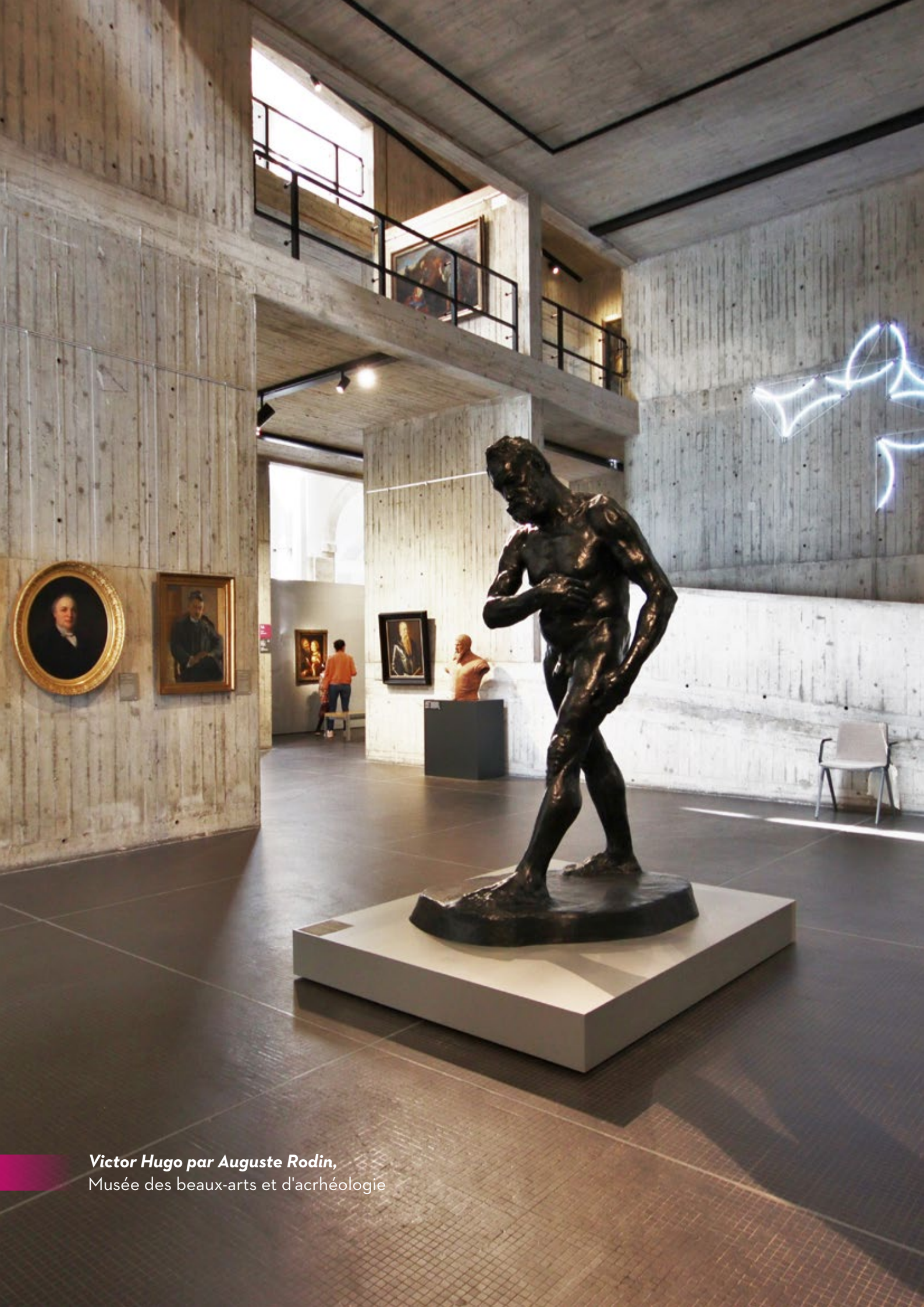
Victor Hugo par Auguste Rodin, Musée des beaux-arts et d'archéologie