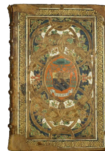
Reliure polychrome aux armes d'Antoine de Granvelle Bibliothèque d'étude et de conservation

La Bibliothèque de Besançon est une des plus anciennes de France. Le fonds initial, créé au XVII e siècle par l'abbé Boisot, s'est constamment enrichi. Aujourd'hui, elle conserve des manuscrits médiévaux remarquables par leurs enluminures, des incunables, des ouvrages et périodiques du XVI e au XXI e siècle ainsi que d'importantes séries de dessins, estampes, cartes postales, affiches et collections numismatiques.