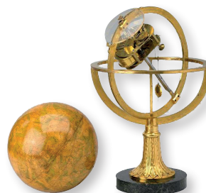
Ferdinand Berthoud, Voûte céleste pourvue d'un mouvement d'horlogerie, ©Musée du Temps

Installé depuis 2002 au palais Granvelle, le plus bel édifice Renaissance de la ville, le Musée du Temps rend hommage à l'histoire et à la tradition horlogère de Besançon. L'évocation de Besançon comme capitale française de la montre s'inscrit dans une réflexion plus large sur la mesure du temps, des premières montres mécaniques jusqu'aux dernières découvertes dans le domaine du quartz et du temps-fréquence.