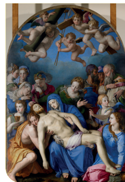
Bronzino, Déploration sur le Christ mort , Musée des Beaux-Arts et d'Archéologie

16 novembre 2018 , Réouverture du musée avec sa nouvelle présentation des collections dont un important patrimoine archéologique de l'Égypte antique aux époques gallo-romaine et médiévale ainsi qu'une collection exceptionnelle de peintures représentatives des principaux courants picturaux de la fin du XV e au début du XX e siècle et qui réunit des chefs-d'œuvre de Bellini à Matisse.